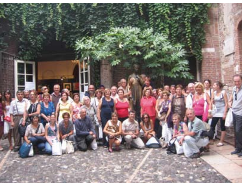
Nella foto in alto il gruppo che ha partecipato alla gita a Verona