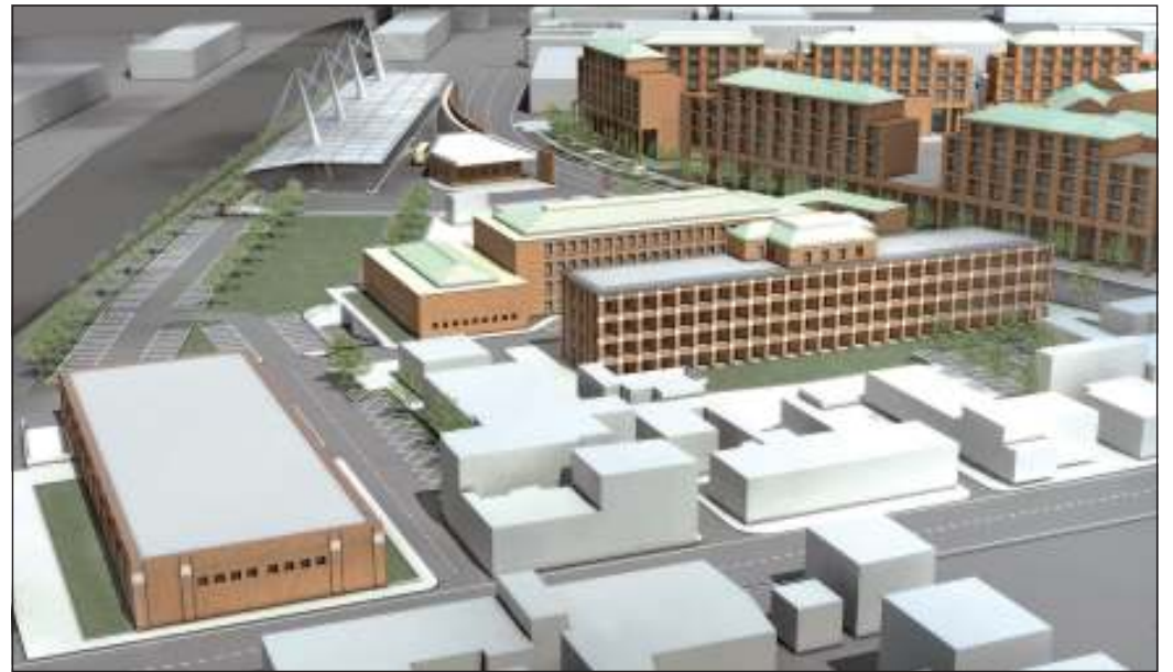
Una delle contestazioni riguarda l'altezza dei futuri edifici

Quello che fondamentalmente non piace ai residenti, oltre al progetto in generale, sono alcuni punti, come il grande giardino pubblico che do-